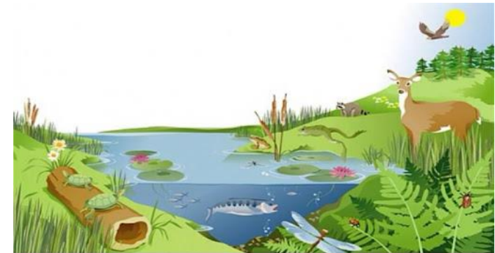
Illustration by Jeff Grader / property of Delta Education

ایکوسیستم یک محیط طبیعی است که در آن موجودات زنده و غیرزنده باهم تعامل دارند.